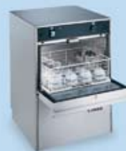
LB 035 &amp; 040

Fremstillet af komponenter og materialer af høj kvalitet.