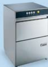
LB 1 &amp; 2