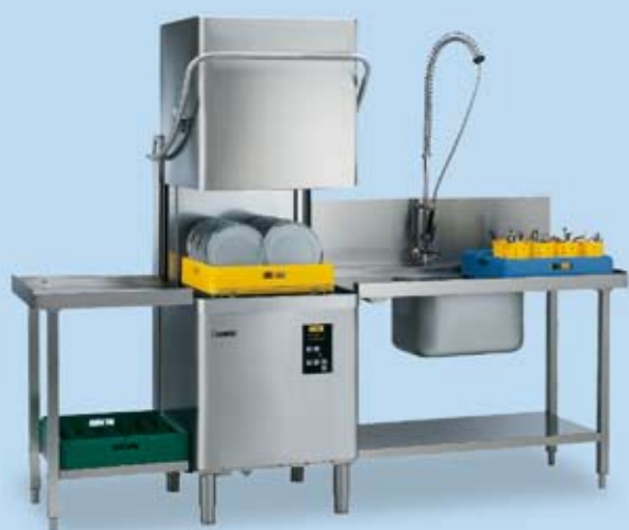
LS 10 & 14